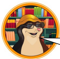
БИБЛИОТЕКАРЬ СУМЧАТЫЙ КРОТ

Благодаря тебе я смог сделать свою библиотеку ещё лучше! Спасибо за помощь!