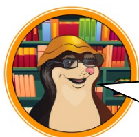
БИБЛИОТЕКАРЬ СУМЧАТЫЙ КРОТ

Рыба-Ёж, к десятилетию библиотеки я хочу открыть новый отдел детской литературы. Могу ли я купить у тебя книги сказок?